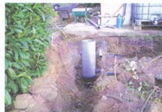
Saneamendu kolektiboan sartzeko, obrak etxe inguruetan

Herri barnean saneamendu sarearen hedatze - Obren hedatzea, "Estekatea" aldean eta RD 251 gainean, bururatu berria da. Berrogei bat etxe lotuko dira sariari. Horrela, kasik herri barne guzira saneamendu kolektiboari